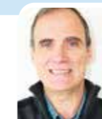
Freddy VASSEUR indépendant